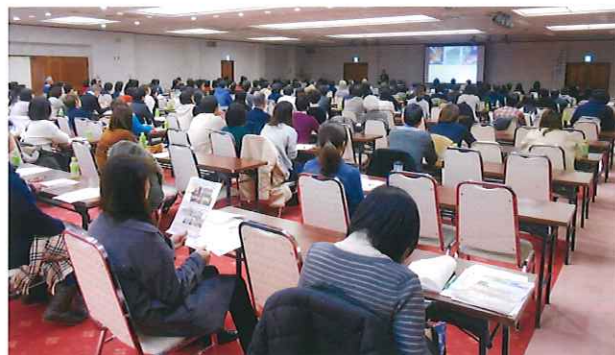
平成 28 年 2 月 7 日「認知症予防のための回想法・まちづくり」研修会の様子

参加者の方には決定後、お支払方法等の詳細を明記した参加証をお送りさせていただきます。