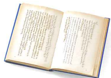
福田尚代《冬眠》2007年 本に刺繍 うらわ美術館蔵