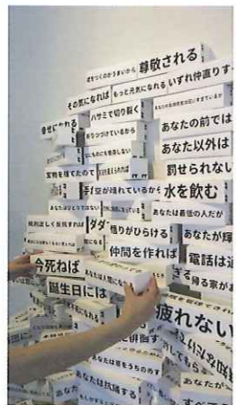
TOLTA《dada/ポジティブな呪いのつみき》2016年