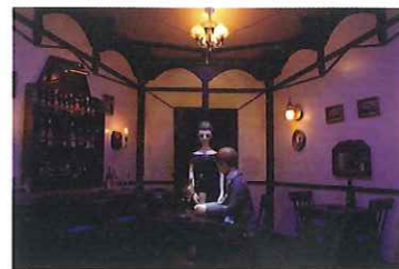
ムットーニ《題のない歌》 (原作・萩原朔太郎) 2016年 作家蔵

「 1 / 2 」から「 1 / 2 」まで ヒックリコと歩く アートから「 1 / 2 」まで ガククリコと歩く 歩くこと 意味が氷が 「 1 / 2 」のまゝが 見えてくる 歩くことは せいのを 「 1 / 2 」み角くこと 斗びと耳まきにひかって 沈黙と涙のハに ひかって ヒックリコと ナメと文字にひかって 意味と無き味に ひかって ガククリコと 1 / 2 」の故郷へと 歩みはじめる時が ついにやって来たのだ