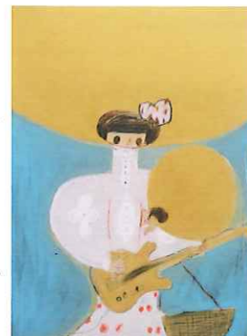
荒井良二《旅する門》(みちのおくの芸術祭 山形ビエンナーレ2014)