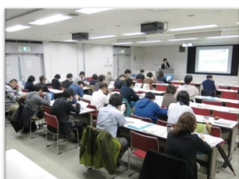
「環境問題」セミナー