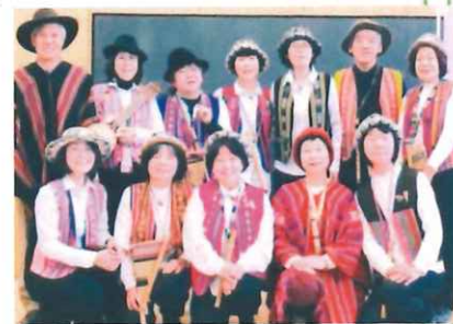
ケ-カ-クル 鳥と風 12:20~12:50