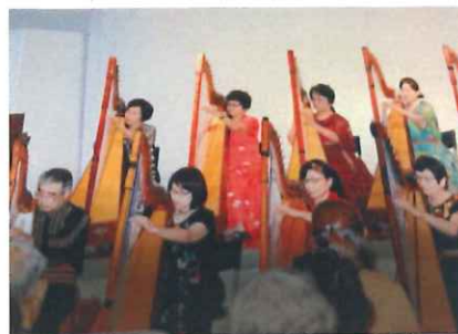
前橋アルパクラブ 11:40~12:10