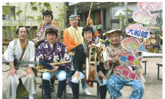
第16回前橋ちんどん大賞受賞チーム「ちんどん寺町一座」(岩手)