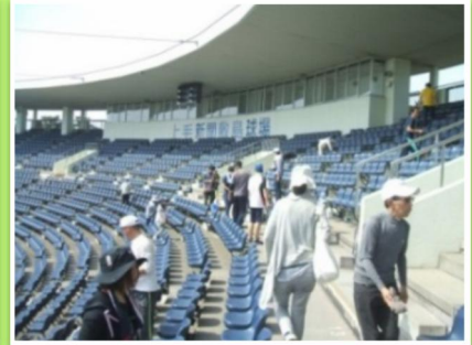
▲球場の観客席清掃