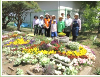
▲花壇の花植、手入れ