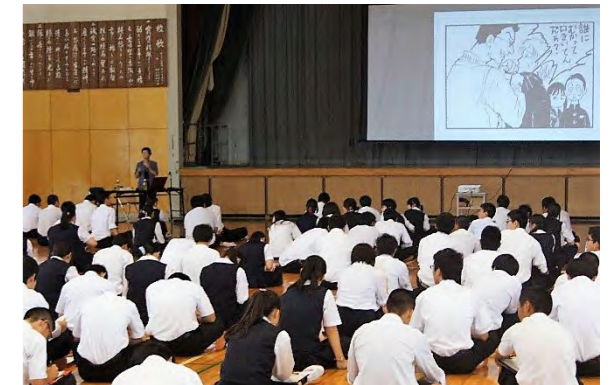
県内の高校「デートDVワークショップ」