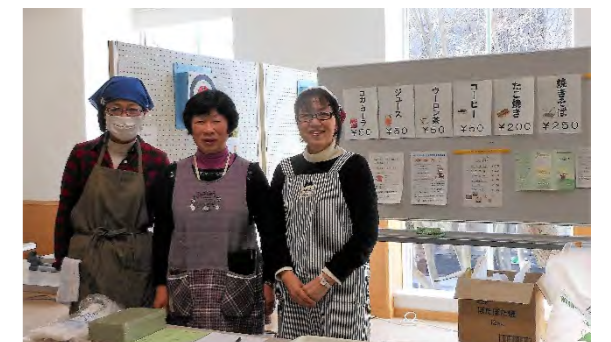
Mサポふれあい祭り バザー出展 (DV被害者保護シェルター資金集め)