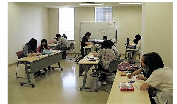
ひこばえ無料学習会