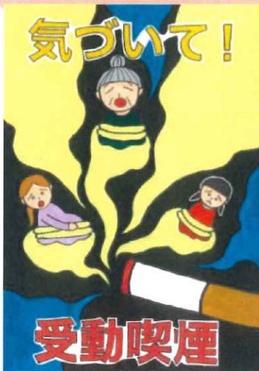
昨年度の最優秀作品 桐生市在住 小学生の作品

5月31日は、世界禁煙デーです。 たばこを吸うことは、体にたくさんの悪い 影響があります。そのことをもっと多くの人に 知ってもらうためのポスターを募集します。