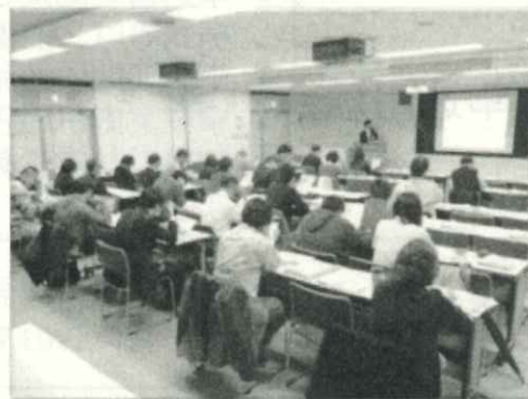
「環境問題」セミナー