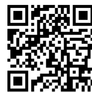
申請ページ QR コード

この配分では、地域福祉活動計画に沿った事業など、前橋市域内全体を見渡しながろーズ調整して実施する事業や、地域福祉の課題解決に向けて住民参加を積極的に促しながら実施する事業を優先します。