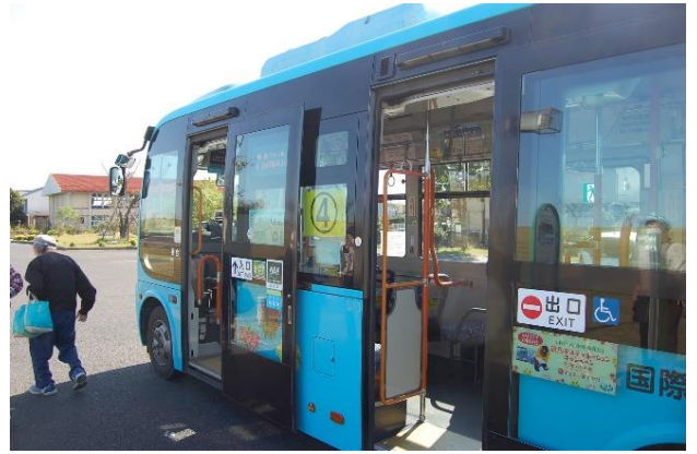
調査活動で、伊勢崎市のコミュニティバスに乗車！表示が大きくて見やすい。料金は1日200円。

「公共交通がなくなってしまうと、元には戻りません。まずは利用を増やすことが大事ですが、このコロナ禍で厳しい状況です。公共交通を自分ごととして考えるきっかけとなるようなイベントを開催できないかと考えています。市民が1ヶ月に1回、公共交通を使うことでかなり利用が増えます。どうか